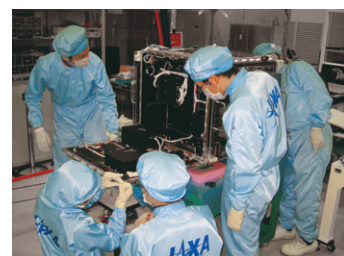
▲ 設計確認会と若手技術者によるフライトシステムの組み立て Design review and in-house integration of flight system by young engineers.