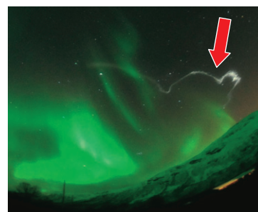
オーロラとロケットから放出された白色のTMA（トリメチルアルミニウム）発光

Aurora seen in high-latitude regions is a luminous phenomenon caused by particles precipitating from higher altitudes that excite atmospheric particles at an altitude of approx. 100 km (the lower part of the thermosphere). The JAXA's sounding rockets have been launched at high-latitude regions such as Norway for the observation of aurora-related phenomena.