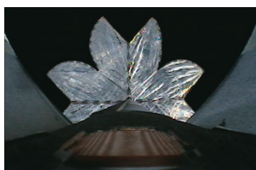
搭載カメラが捉えたソーラーセイル展開の様子 The deployment of Solar-sail caught by the on-board camera.

Since the atmosphere and gravity are very influential in experiments on the earth, there are limitations to the deploy experiment of large structures such as the Solar-sail membrane. Sounding rockets are used for various engineering experiments, using microgravity and high vacuum environments during ballistic flight, including functions and performance verifications of new observation instruments and technical components that are expected to be loaded on future satellites and space explorers.