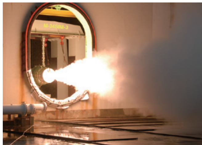
イプシロンロケット技術要素試験(M-34SIM-3モーター大気燃焼試験)