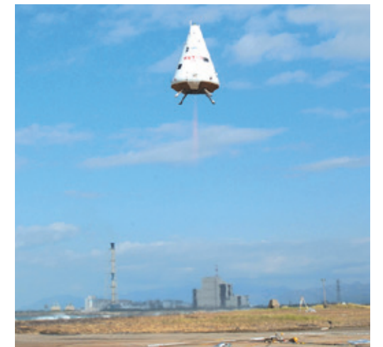
再使用ロケット実験機の垂直離着陸実験(2003年10月)