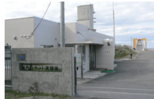
能代ロケット実験場入口

施設の一部を見学コースとして紹介しています。 所要時間は約60分です。 *見学ご希望の方は事前に予約をお願いします。 ●見学対応時間 午前9時00分～午後4時00分(要予約) ●休日 土・日・祝日・年末年始