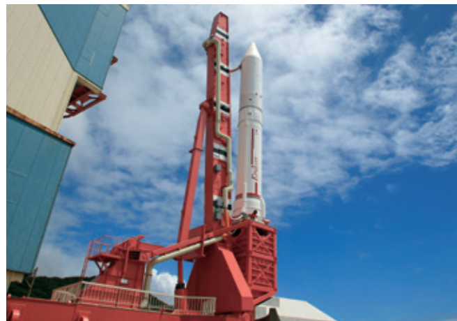
イプシロンロケット試験機(内之浦宇宙空間観測所)

Mロケットやイプシロンロケットなどの固体ロケットモータ技術の発展を支えた能代ロケット実験場は、先進的な固体ロケット技術の研究開発拠点として活用されています。