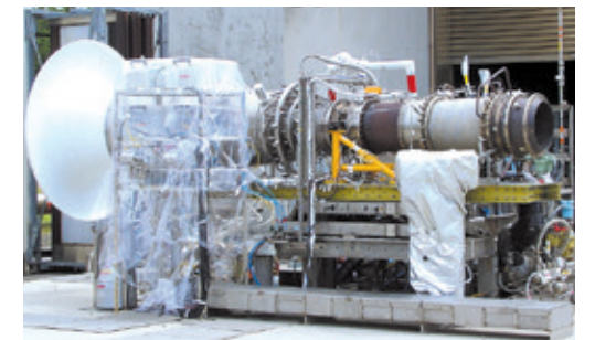
エアターボラムジェットエンジンの燃焼実験(2003年8月)

また、クリーンなエネルギー源として注目されている水素が広く一般社会で用いられるように、液体水素を使いこなすための基盤的な技術研究にも取り組んでいます。