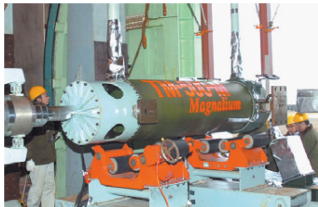
マグナリウム入り固体コンポジット推進薬を用いる固体モータの技術実証試験(2006年12月)