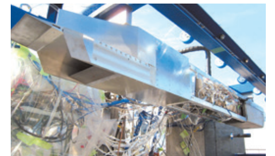
小型予冷ターボジェットエンジンの燃焼試験(2007年11月)