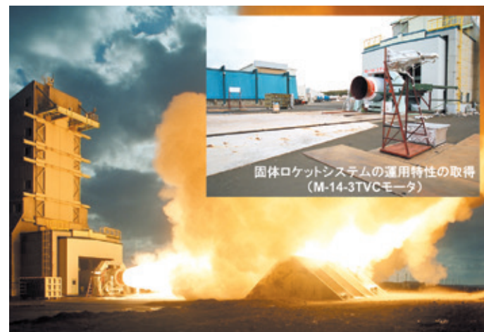
大型固体ロケットモータの地上燃焼試験におけるシステム運用特性の取得(M-14-3TVCモータ)